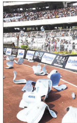
■ যুবভারতীর ভাঙচুরের ছবি।

মেসি-ইভেন্টের উদ্যোক্তার এক ঘনিষ্ঠ ক্লাব কর্তা বললেন,