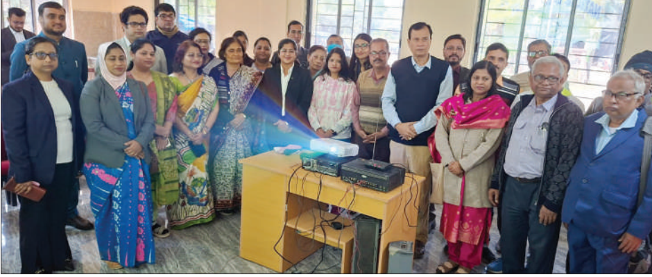
■ লোক আদালতের বিচারকরা। রবিবার, পশ্চিম মেদিনীপুরে।

সংবাদদাতা, মেদিনীপুর : সুদ-সহ কৃষিগণ বাকি ছিল ১ লক্ষ ৭৬ হাজার টাকা। তা পরিশোধ করতে না পারায় পশ্চিম মেদিনীপুর জেলায় লোক আদালতের দ্বারস্থ হন ৭০ বছরের এক বৃদ্ধ। শেষে তিনি মাত্র ১০ হাজার টাকায় লোন পরিশোধ করার নির্দেশ পেলেন। এছাড়াও ক্যানসার রোগী, কিডনি রোগীদের ক্ষেত্রেও বিশেষ ছাড় দিয়েছেন ব্যাঙ্ক কর্তৃপক্ষ। কেউ কেউ প্রেসক্রিপশন ছাড়া ওষুধ নিয়েও হাজির হয়েছিলেন। শনিবার মেদিনীপুর জেলায় লোক আদালতের ২২টি বেঞ্চ বসেছিল। প্রতিটি বেঞ্চ