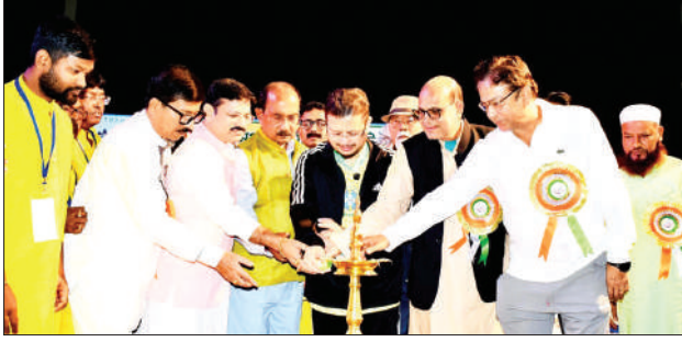
■ মধ্যমগ্রামে আইএনটিটিইউসি'র কর্মী সম্মেলনের সূচনায় সংগঠনের রাজ্য সভাপতি ঋতব্রত বন্দ্যোপাধ্যায়। রবিবার।