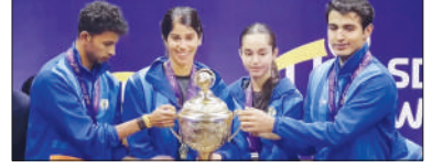
হংকংকে ৩-০ ফলে হারিয়ে প্রথমবার স্কোয়াশ বিশ্বকাপ চ্যাম্পিয়ন ভারত