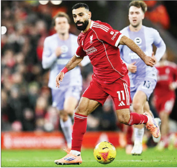
বল নিয়ে এগোচ্ছেন সালাহ। ব্রাইটনের বিরুদ্ধে প্রিমিয়ার লিগের ম্যাচে।

ঘরের মাঠ অ্যানফিল্ডে খেলা শুরুর এক মিনিটেই এগিয়ে গিয়েছিল লিভারপুল। জো গোমেজের হেড থেকে বল পেয়ে গোল করেন হুগো একিতিকে। অন্যদিকে, সালাহকে শুরুতে রিজার্ভ বেঞ্চে বসিয়ে রেখেছিলেন লিভারপুল কোচ। কিন্তু ২৬ মিনিটে চোট পেয়ে মাঠ ছাড়তে বাধ্য হন জো গোমেজ। তাঁর পরিবর্ত হিসাবে মাঠে