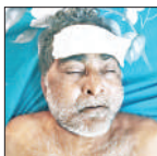
ধরেই এসআইআর তালিকায় নাম না থাকা নিয়ে দৃশ্টিভ্রান্ত ছিলেন।