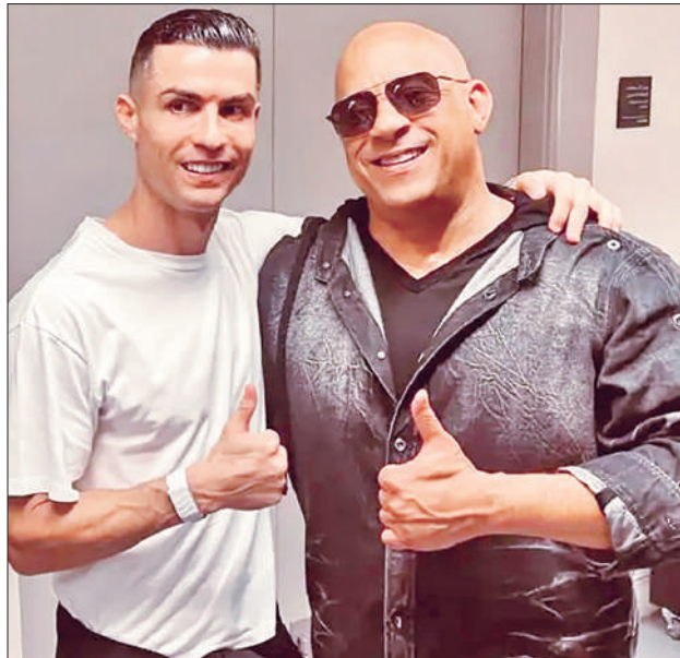
হলিউড অভিনেতা ভিন ডিজেলের সঙ্গে ফুটবলের মহাতারকা রোনাল্ডো।

ছবিতে অভিনয় করতে চলেছেন সিআর সেভেন! ৪০ বছর বয়সি রোনাল্ডো এই বয়সেও দারুণ ফর্মে। প্রায় প্রতি ম্যাচেই গোল করছেন। সম্প্রতি এক সাক্ষাৎকারে পর্তুগিজ মহাতারকা জানিয়েছিলেন, তাঁর অবসরের সময় ক্রমশ এগিয়ে আসছে। ফুটবলকে বিদায় জানানোর পর, নিজেকে অন্য ভূমিকায় দেখতে চান। রোনাল্ডোর ওই মন্তব্যের পরেই ভিন ডিজেলের এই পোস্ট। ফলে ফুটবলার রোনাল্ডোকে এবার অভিনেতার ভূমিকায় দেখার জন্য মুখিয়ে রয়েছেন ভক্তরা। তবে সামনেই ফুটবল বিশ্বকাপ। রোনাল্ডোর যাবতীয় ফোকাস এখন বিশ্বকাপে। তাই কবে তাঁকে রুপোলি পদারি দেখা যাবে, তাই নিয়ে সংশয় রয়েছে।