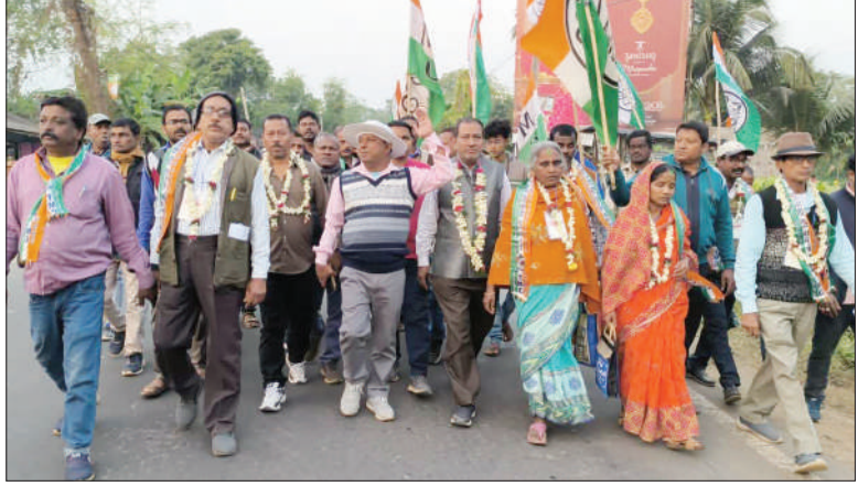
■ দলের জয়ী ছয়জনকে নিয়ে তৃণমূল নেতা-কর্মীদের মিছিল। ডেবরার ব্রাহ্মণশাসনে।