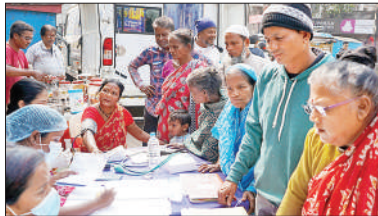
■ মোবাইল চিকিৎসাকেন্দ্রে মানুষের ভিড়।

প্রতিবেদন : সকাল সাড়ে ৯টায় স্বাস্থ্য দফতরের ভ্রাম্যমাণ চিকিৎসা ভ্যান পশ্চিম মেদিনীপুরের বটতলা চক এলাকায় এসে দাঁড়াতেই মুহূর্তে পাড়ার মানুষের ভিড় ও ছোড়াছড়ি শুরু হয়ে গেল। মাত্র ৫০ মিটার দূরেই মেদিনীপুর মেডিক্যাল কলেজ হাসপাতাল থাকতেও ভ্রাম্যমাণ চিকিৎসা ভ্যানের সামনে কেন মানুষের এই লাইন জানা গেল স্থানীয়দের কাছেই। তাঁদের বক্তব্য, হাসপাতালে দীর্ঘক্ষণ লাইনে দাঁড়িয়ে থাকতে হয়। পাড়ার কাছেই যখন চিকিৎসা মিলছে, তখন এখানেই একবার দেখানো বেশি সুবিধার। আবার ছুটির দিনে হাসপাতালের আউটডোর বন্ধ থাকায় এই সুযোগে ভ্রাম্যমাণ চিকিৎসাকেন্দ্রে চেকআপ করিয়ে নিলেন অনেকেই। বর্তমানে পশ্চিম মেদিনীপুরে ১৯টি মোবাইল চিকিৎসা ভ্যান রয়েছে। ২১টি ব্লক ও ৭টি পুরসভা এলাকায় রুটিনমাসিক ঘুরে ঘুরে পরিষেবা দেওয়া হচ্ছে। প্রতিদিন বহু মানুষ এর সুবিধা নিচ্ছেন। দুপুরে পরিষেবা খতিয়ে দেখতে