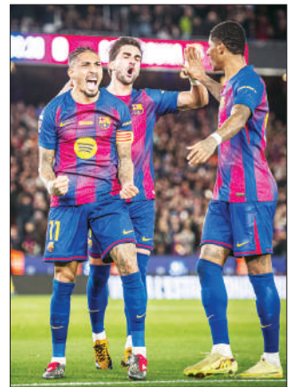
রাফিনহাকে নিয়ে উচ্ছ্বাস সতীর্থদের।

এদিকে, রবিবার ভারতীয় সময় গভীর রাতেই রিয়াল মাঠে নামছে আলাভেজের বিরুদ্ধে। সব টুর্নামেন্ট মিলিয়ে শেষ ৮ ম্যাচে মাত্র দু'টিতে জয় পেয়েছে রিয়াল। কোচ জাবি আলোসোর চেয়ারও টলমল। গোদের উপর বিষফোঁড়ার মতো এই ম্যাচেও কিলিয়ান এমবাপের মাঠে নামা নিয়ে সংশয় রয়েছে।