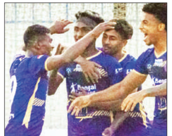
■ রবির গোল-উৎসব। রবিবার