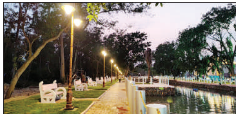
■ দিঘার এই নেচার পার্কে আসছে ডাইনোসরের দল।

চারিদিকে সবুজে ঘেরা জঙ্গল। তারই মাঝে জুরাসিক যুগের রূপকথার গর্জন। রোমাঞ্চে ভরা প্রাচীন ডাইনোসরদের প্রতিরূপ এবার দেখা যাবে দিঘায়। পৃথিবীর বাস্তবত্বের প্রাগৈতিহাসিক অধিবাসী তথা পৃথিবীর বুকে প্রায় ১৬ কোটি বছর ধরে রাজত্ব করা ডাইনোসরের দেখা মিলবে সমুদ্রপাড়েই। পর্যটকদের কাছে এই খবর ছড়িয়ে পড়তেই দিঘার আকর্ষণ ইতিমধ্যেই বেশ কয়েক গুণ বেড়ে গিয়েছে। জানা গিয়েছে, সবুজ গাছগাছালিতে মোড়া জগন্নাথ মন্দিরের সামনেই অবস্থিত নেচার পার্কের মধ্যে ঘুরে বেড়াবে ডাইনোসররা। এক বেসরকারি সংস্থার মাধ্যমে দেশের বাইরে থেকে এই সমস্ত মুভিং ডাইনোসর ইতিমধ্যে আনাও হয়েছে। সেগুলিই গর্জন করতে করতে ঘুরে বেড়াবে গোটা