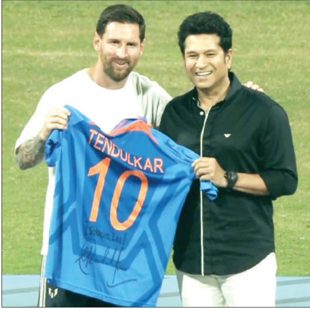
■ ২০১১ বিশ্বকাপ জয়ের জার্সি মেসিকে উপহার দিলেন শচীন। মুম্বইয়ে।

মধ্যে যখন শচীনকে ডাকা হল তখন ওয়াংখেড়ে জুড়ে গর্জন। ২০১১ বিশ্বকাপে খেলা তাঁর ১০ নম্বর নীল জার্সি মেসিকে উপহার দিলেন শচীন। পাণ্টা বিশ্বকাপ বল