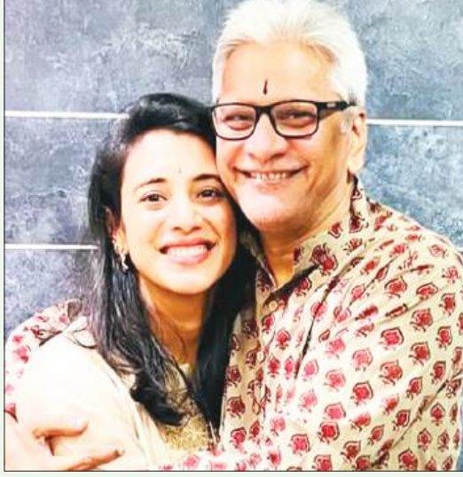
■ বাবার সঙ্গে স্মৃতি। ফাইল চিত্র