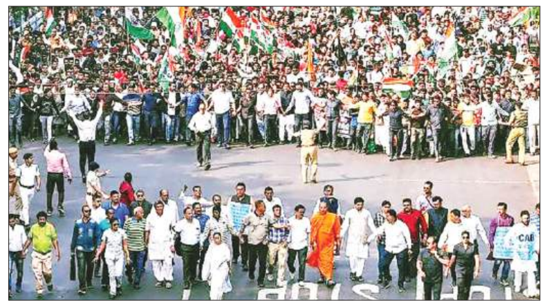
জননেত্রী এজন্যই এসআইআর বন্ধ করার আর্জি জানিয়েছেন।

২৩ নভেম্বর, ২০২৫, রবিবারের ঘটনা। ঘটনাস্থল বর্ধমান জেলার কাটোয়া বিধানসভা এলাকা। এনুমারেশন ফর্ম সংগ্রহ করতে গিয়ে যুগপৎ কর্মব্যস্ততার চাপে ও কমিশনের বিজেপির ভোটসখাসুলভ হুমকিতে অসুস্থ হয়ে পড়লেন এক বিএলও। গুরুতর অবস্থায় তাঁকে কাটোয়া মহকুমা হাসপাতালে ভর্তি করানো হয়েছে। কোনও রাজনৈতিক দল নয়, বিএলওর স্বীকৃতি দিয়েছেন, ভোটার তালিকার বিশেষ নিবিড় সংশোধনের (এসআইআর)