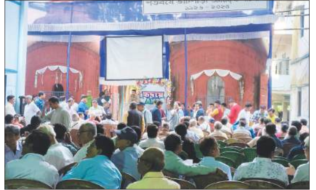
■ উত্তর ২৪ পরগনার ঐতিহ্যবাহী শিক্ষা প্রতিষ্ঠান ভাটপাড়া অমরকৃষ্ণ পাঠশালার শতবার্ষিকী উদযাপনের অঙ্গ হিসাবে রবিবার এক বর্ণময় পুনর্মিলন উৎসবের আয়োজন করা হয়। চার প্রজন্মের প্রাক্তন পড়ুয়া ও শিক্ষকরা দিনভর নানা কর্মসূচিতে অংশ নেন। ছিল সাংস্কৃতিক অনুষ্ঠান ও মধ্যাহ্নভোজ।