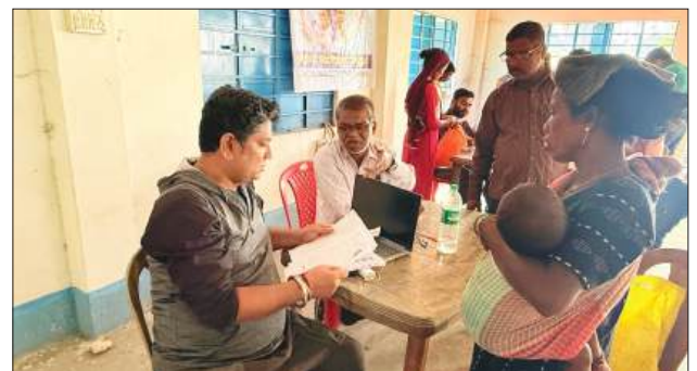
■ দার্জিলিং জেলা আইএনটিটিইউসি'র উদ্যোগে আজ তরাইয়ের অটল চা-বাগানে বাংলার ভোটারদের শিবির অনুষ্ঠিত হয়। শিবিরে সবাইকে এসআইআর নিয়ে সচেতন করার পাশাপাশি চা-শ্রমিকদের এসআইআর ফর্ম পূরণে সহায়তা প্রদান করা হয়।

সংবাদদাতা, জঙ্গিপুর : ভোটার লিস্টে নামের গরমিলকে কেন্দ্র করে ভগবানগোলায় তৈরি হয়েছে চাঞ্চল্য। অভিযোগ, এলাকার এক বৃদ্ধ বহুদিন ধরেই সরকারি নথিপত্রে পরিচয় ও নামের ঠিক বানান সংশোধনের জন্য একাধিকবার আবেদন করলেও তা সংশোধন করা হয়নি। বৃদ্ধের পরিবারের অভিযোগ, ভোটার তালিকায় নামের বানান ভুল থাকায় সরকারি পরিষেবা পাওয়ার ক্ষেত্রেও নানা সমস্যা পড়তে হচ্ছে। দ্রুত তদন্ত ও সংশোধনের দাবিতে স্থানীয় বাসিন্দারা সরব হন। প্রশাসনের পক্ষ থেকে জানানো হয়েছে, ভুল খতিয়ে দেখা হচ্ছে। দ্রুত প্রয়োজনীয় সংশোধনের ব্যবস্থা নেওয়ার আশ্বাসও দেওয়া হয়েছে। ঘটনায়কে ঘিরে ভবানগোলায় উত্তেজনা রয়েছে।