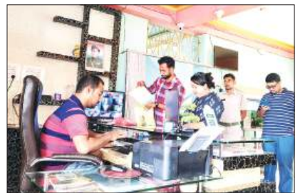
■ হোটেলে চলছে তল্লাশি অভিযান।

সংবাদদাতা, বসিরহাট : শীতকাল মানেই পিকনিকের মরশুম। এই সময় পর্যটকদের সুরক্ষার কথা মাথায় রেখে টাকিতে খাদ্য সুরক্ষা দফতর সহ তিনটি দফতরের বিশেষ অভিযান শুরু হল। সরকারি উদ্যোগে চলবে এই অভিযান পর্ব। পর্যটকদের অন্যতম আকর্ষণ এই টাকি। পর্যটন শিল্পকে কেন্দ্র করে এখানে তৈরি হয়েছে একাধিক হোটেল, গেস্ট হাউস এবং লজ। অন্যান্য সময়ের থেকে শীতের মরশুমে সংখ্যাটা অনেকটাই বেশি থাকে। তাই এবার পর্যটকদের শারীরিক সুস্থতার কথা মাথায় রেখে বসিরহাট খাদ্য সুরক্ষা দফতরের উদ্যোগে ক্রেতা সুরক্ষা দফতর, বসিরহাট এনফোর্সমেন্ট ব্রাঞ্চ ও ডিস্ট্রিক্ট