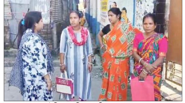
■ থানায় চলেছেন উদ্বিগ্ন নাবালিকার পরিজনরা।

এলাকাবাসীর মধ্যে ফিরে এসেছে সুস্থ ভবিষ্যতের আশা।