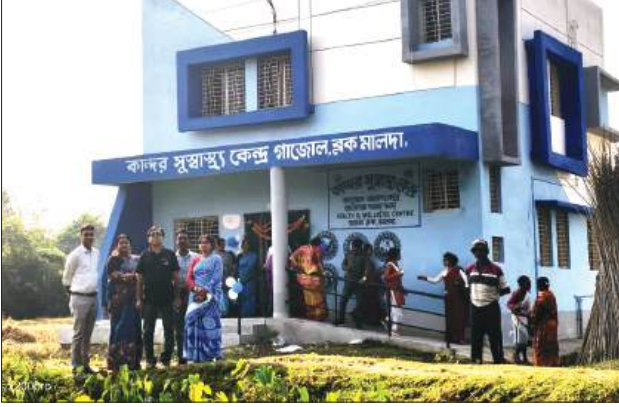
■ সুস্বাস্থ্য কেন্দ্রের সামনে স্বাস্থ্য আধিকারিক এবং জনপ্রতিনিধিরা।

সংবাদদাতা, মালদহ : দীর্ঘদিনের প্রত্যাশার অবসান ঘটিয়ে আধুনিক স্বাস্থ্য পরিকাঠামোর এক নতুন অধ্যায় শুরু হল এলাকার মানুষের জন্য। উন্নত চিকিৎসা পরিষেবার লক্ষ্যে সদ্য উদ্বোধন হওয়া সুস্বাস্থ্য কেন্দ্রটি গাজোলের গ্রামীণ জনজীবনে নিয়ে এসেছে আশার আলো। উদ্বোধন অনুষ্ঠানে উপস্থিত ছিলেন প্রশাসনিক ও স্বাস্থ্য দফতরের নীর্ষা আধিকারিকরা এবং জনপ্রতিনিধিরা। তাঁদের উপস্থিতিতে এই কেন্দ্রের আনুষ্ঠানিক সূচনা হয়। স্বাস্থ্য দফতরের উদ্যোগে প্রায় ৩৪ লক্ষ টাকা ব্যয়ে নির্মিত এই ভবনটি