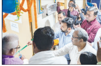
■ মেশিনের সূচনা করছেন জেলাশাসক।

সংবাদদাতা, পাঁশকুড়া : যক্ষ্মা রোগ নির্ণয়ে উন্নত পরিষেবার লক্ষ্যে নয়া উদ্যোগ পাঁশকুড়া সুপার স্পেশালিটি হাসপাতালে। বৃহস্পতিবার অত্যাধুনিক কোয়াট্রো ট্রুনাট মেশিন বসল। হলদিয়া পেট্রোকেম মালিকানাধীন সহযোগী প্রতিষ্ঠান অ্যাডপারমার কর্পোরেট সোশ্যাল রেসপন্সিবিলিটি (সিএসআর) ফান্ড থেকে এই উচ্চমানের মেশিন বসানো হয়েছে। চলতি ২০২৫-২৬ অর্থবছরে এটি একটি বড় উদ্যোগ বলা যায়।