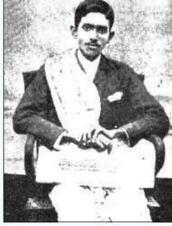
মৃতদেহ তাঁর পরিবারের হাতে তুলে দেয়নি ব্রিটিশ পুলিশ।

এদিন ফাঁসির মধ্যে জীবনের জয়গান গেয়েছিলেন। আলিপুর বোমার মামলার যখন বিচার চলছিল, তখন নরেন গোসাঁই রাজসাক্ষী হলেন। হেমচন্দ্র দাস কানুনগো ও সত্যেন্দ্রনাথ, দুজনেই তখন জেলে। সেখানে বসেই সিদ্ধান্ত নেন বিশ্বাসঘাতক নরেন গোসাঁইকে খতম করে দেওয়া হবে। তাঁরা দুটি রিভলভার জোগাড় করেন। কানাইলাল দত্তও এই কাজে যোগ দিতে চান। সত্যেন্দ্র ও কানাইলাল অসুস্থ হয়ে হাসপাতালে ভর্তি হন। সেখান থেকে সত্যেন্দ্রনাথ নরেনকে চিঠি দিয়ে জানান, তিনিও রাজসাক্ষী হতে চান। সেই চিঠি পেয়ে নরেন হাসপাতালে