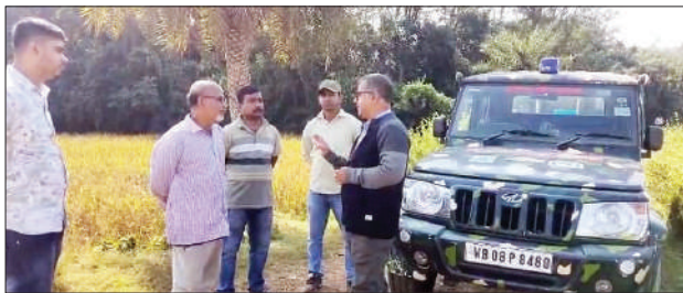
■ বন বিভাগের কর্তা ও বনকর্মীরা সচেতনতা প্রচার করছেন।

টিউশন পড়তে গেলে তাদের সঙ্গে থেকে বাড়ি ফেরানোর ব্যবস্থা করুন। শিয়ালকে ভয় দেখানোর জন্য হাতে লাঠি রাখুন। তবে কখনই শিয়ালদের লাঠি দিয়ে আঘাত করবেন না। এলাকায় বন্য জীবজন্তু দেখলে বন দফতরে খবর দিন। বন দফতর আপনাদের পাশে আছে। বর্ধমানের কুড়মুন, সোনাপালাশি ও তার আশপাশের বাসিন্দারা শিয়ালের