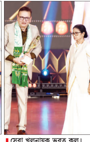
■ সেরা খলনায়ক ভরত কল। (পরশুরাম আজকের নায়ক)