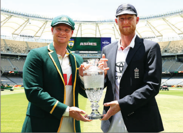
■ অ্যাসেজ হাতে দুই অধিনায়ক স্মিথ ও স্টোকস। বৃহস্পতিবার পারথে।

ব্যাপারটা দাঁড়িয়েছে এমন, অ্যাসেজে স্টোকসদের ঘুরে দাঁড়ানোর ক্ষেত্রে ভরসা এখন তরুণরাই। কিন্তু বললেই সেটা সহজ হবে না। স্টিভ স্মিথ, মিচেল স্টার্ক, উসমান খোয়াজা, স্কট বোল্যান্ড, হ্যাডলউডদের এটাই হয়তো