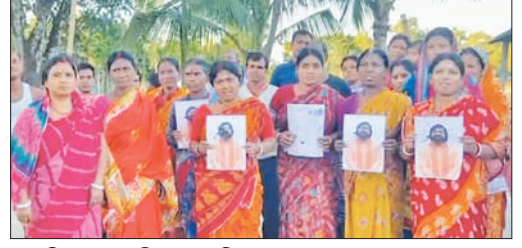
■ ছবি হাতে প্রতিবাদে মহিলারা।

পাহাড়ের বাসিন্দারাও রয়েছে আতঙ্কে। নিরীহ পাহাড়বাসীরা এসবের কিছুই বুঝতে পারছেন না। কিন্তু তাদের ঘিরে ধরেছে ভয়। কী করবেন তাঁরা? মাথার ওপর ছাদটা চলে যাবে না তো? এই ভয় তাড়া করছে। তবে জেলা প্রশাসনের আধিকারিকরা পাশে দাঁড়িয়েছেন। ফর্ম-ফিলাপ করে দিচ্ছেন। পাহাড়বাসীদের পাশে আছে প্রশাসন তা বোঝানো হচ্ছে। খোলা হয়েছে একাধিক সহায়তা শিবিরও।