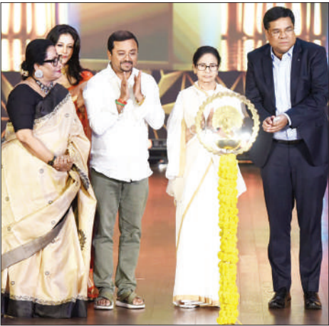
■ অনুষ্ঠানের উদ্বোধনে মুখ্যমন্ত্রী মমতা বন্দ্যোপাধ্যায়।