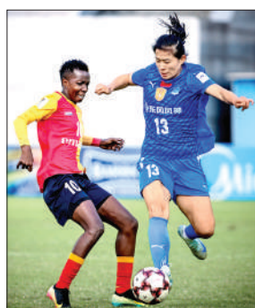
■ ম্যাচে বল দখলের লড়াই।