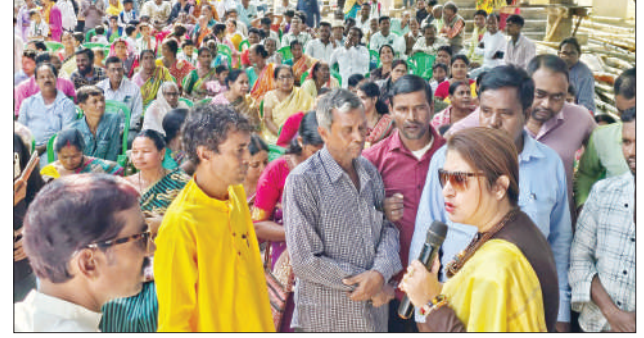
■ সিউডি ২ ব্লকের একাধিক ভোটসুরক্ষা শিবির পরিদর্শনে বীরভূম লোকসভা কেন্দ্রের সাংসদ শতাব্দী রায়। বৃহস্পতিবার।

বিধায়ক, জেলা সভাপতি ও নেতৃত্বের সঙ্গে আলোচনা করা হয়েছে। বুধস্তরে বিএলও-দের মানুষের পাশে থাকতে হবে। এসআইআর-এর ফর্ম পূরণ নিয়ে মানুষ বিভ্রান্ত। এমন অনেক মানুষ আছেন, যাদের নাম তালিকার হার্ড কপিতে থাকলেও ওয়েবসাইটে নেই। যাতে প্রতিটি মানুষ ফর্ম পূরণের সুযোগ পায় সে বিষয়ে আলোচনা করা হয়েছে এদিন।