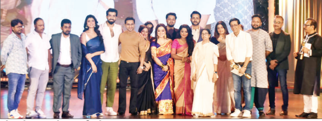
■ প্রিয় পরিবার ধারাবাহিক জগদ্ধাত্রী পরিবার।