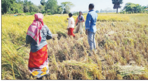
■ দক্ষিণ দিনাজপুরে চাষিদের পাশে দাঁড়িয়েছে দল। ডানদিকে, আতঙ্কিত পাহাড়বাসীদের আশ্বস্ত করছেন প্রশাসনের প্রতিনিধিরা।

সংবাদদাতা, বালুরঘাট ও দার্জিলিং : আতঙ্ক, মৃত্যু, অত্যধিক মানসিক চাপ এখন এসআইআরের অপর নাম। ভোটার তালিকার বিশেষ নিবিড় সংশোধনের নামে সাধারণ মানুষকে বিভ্রান্ত করার খেলায় নেমেছে নির্বাচন। সাধারণ মানুষকে ভিটে মাটি হারানোর উসকানি দিচ্ছে বিজেপি। উত্তরের চা-শ্রমিক, কৃষক এবং পাহাড়ের বাসিন্দারা পড়েছেন বিপদে। ধান কাটার মরশুমে ব্যস্ত। কৃষকেরা আতঙ্কে থাকলে কৃষি কাজ ব্যাহত হতে পারে। সেই দিকে